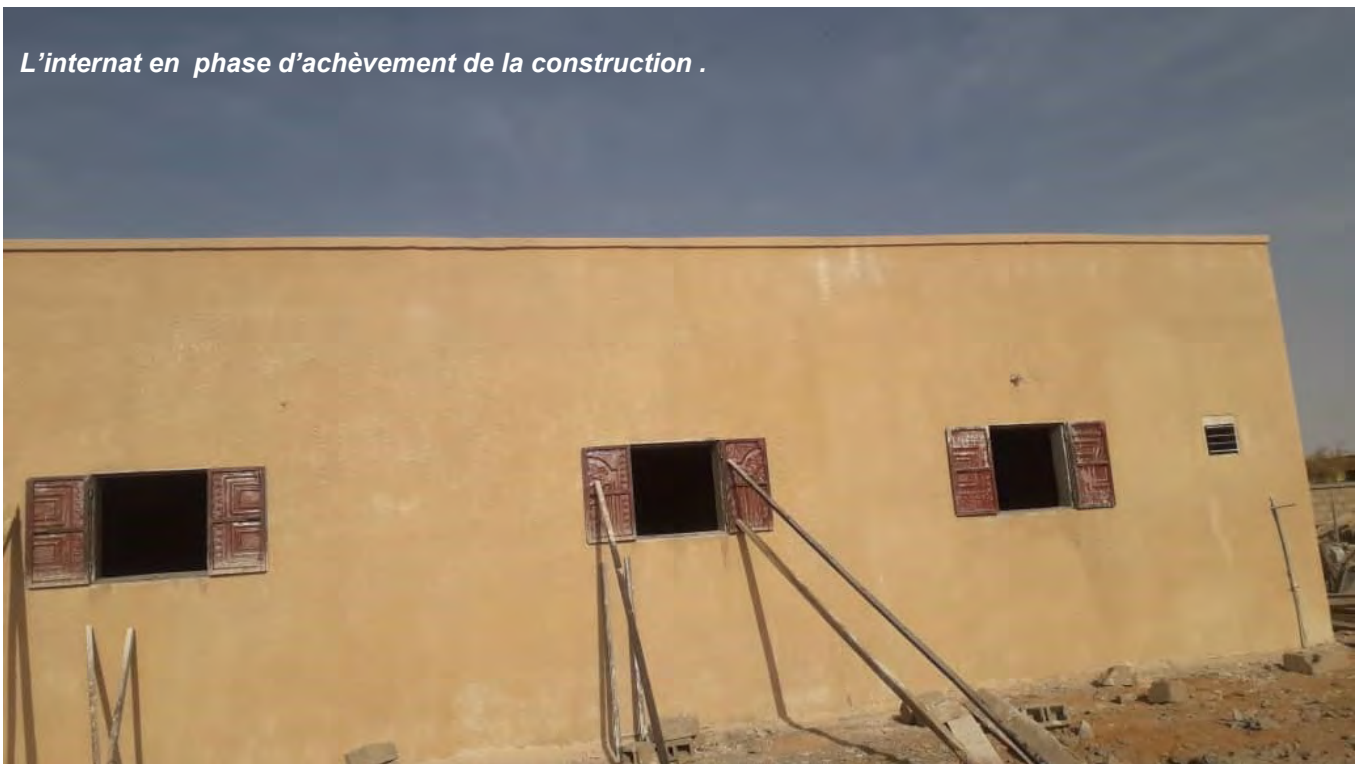
L'internat en phase d'achèvement de la construction .

La convention a été signée avec la mairie qui a donné le terrain. Une convention a également été passée avec "Rain for the Sahel", cette association américaine qui en assurera le fonctionnement quotidien.