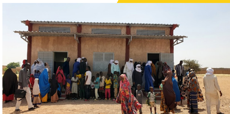
↑ École après rénovation.