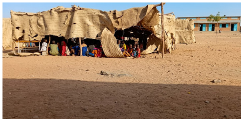
↑ École avant rénovation.

Sur les 3 salles de classe prévues, une vient d'être finalisée, il nous en reste encore 2 à financer.